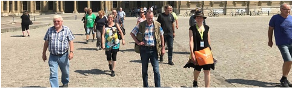
Besichtigung der Festung Marienberg

Nach dem Abstieg ging es zur alten Mainbrücke wo traditionell ein Glas Wein getrunken wird. Am Nachmittag fahren wir ins 30 km entfernte Marktbreit, was mit seiner historischen Altstadt zu einem Weinfest einlud. Weinselig und immer guter Laune aller Mitreisenden ging es am späteren Abend zurück in unser mitten in der Altstadt gelegenes Hotel. Wer noch Lust hatte ging zum "Kiliani Volksfest" oder setzte sich an diesem lauen Sommerabend in einen der netten Biergärten.