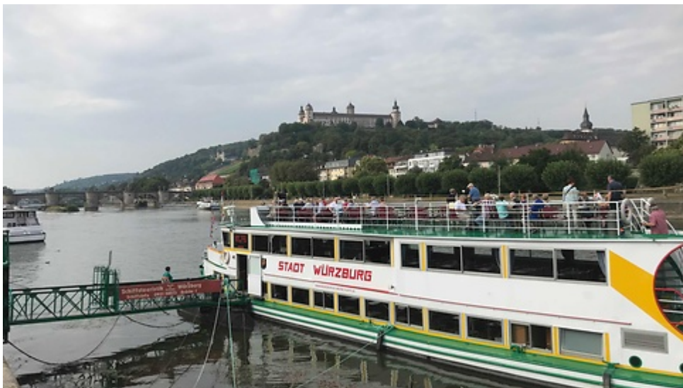
Mit dem Ausflugsschiff auf dem Main unterwegs

Am Montag startete die Rückfahrt mit einer Dampftour über den Main. Uns nahm der Bus in Veitshöchheim wieder auf und anschließend ging es weiter nach Fulda. Hier konnte jeder noch über 2,5 Stunden die Altstadt besichtigen. Alle 39 Mitreisenden waren sich einig: "Es ist immer eine schöne Zeit und wieder ging eine tolle Fahrt mit Freunden zu Ende."